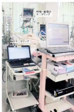
当院 PICU での連続脳波モニタリングの実際の様子

化すると重い後遺症を残してしまいます。呼吸や循環の厳密な管理を担当する救急集中治療科と連携し、「こども医療の最後の砦」としての誇りと責任感を持って診療にあたっています。小児集中治療室においては意識障害やけいれん重積の子どもたちの脳波をリアルタイムでモニタリングできる体制を24時間365日準備し治療に役立っています。この体制がとれるのは兵庫県下では当院だけであり、全国的にみてもその実施件数はトップです。このような神経救急医療体制をこの10年間で築き、後遺症なく退院できる子どもたちの数を飛躍的に高めてきました。現在はポートアイランドの新病院での診療の準備を行っていますが、さらに質の高い医療を子どもたちに提供できるように、日々努力しています。