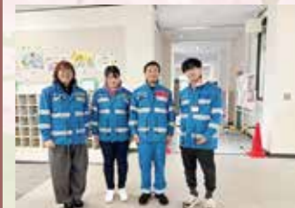
▼(訓練参加時の写真)